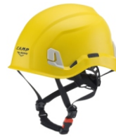
5 - Giallo