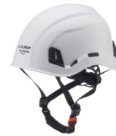
7 - Bianco