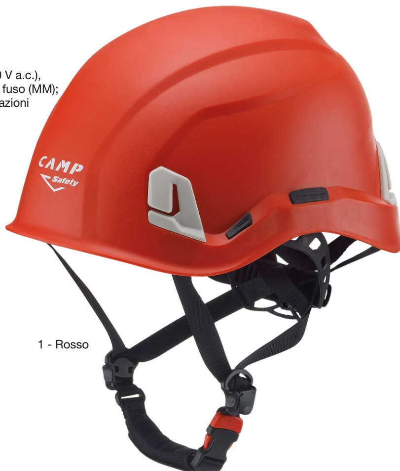
1 - Rosso