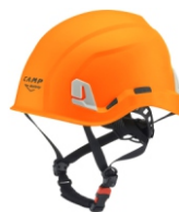
4 - Arancione